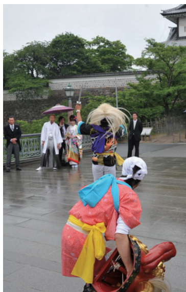
石川門前を舞台に獅子舞などの郷土芸能の演出。