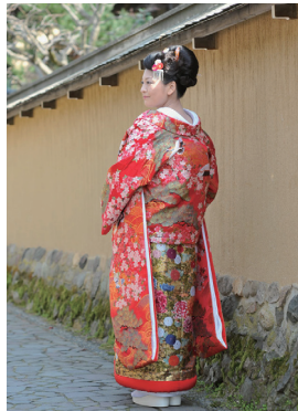
武家屋敷にてロケーションフォト。