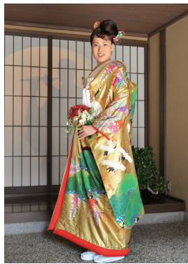
古都金沢らしい影笛の演出。