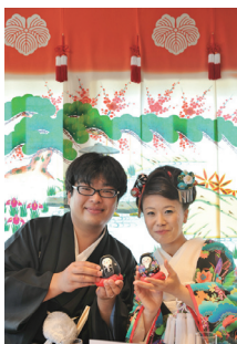
左/顔周りは自毛の半カヅラの簪姫ヘアなど、斬新でおしゃれな和モダンスタイルの提案。右/花嫁のれんや金澤祝言こぼしなど金沢らしい和モダンテーブルコーディネート。