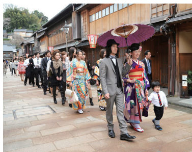
東茶屋街をお子様連れの花嫁行列としてのアニバーサリーフォトなどもおすすめ。

金沢市泉野出町2-22-6 サンルックスビル2F ☎076-214-4555 ※完全予約制 営/12:00~19:00(応相談) 休/木曜(応相談) P/2台 http://www.kanazawa-syugen.jp http://www.kanazawa-syugen.jp/blog