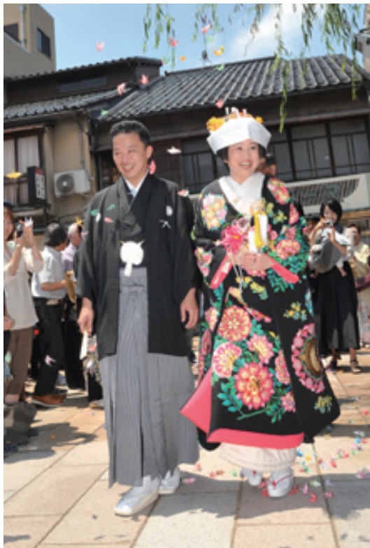
東茶屋街の花嫁行列で、観光客をまきこんで折り鶴シャワーの演出。